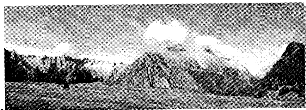
Rifugio Alpe Granda